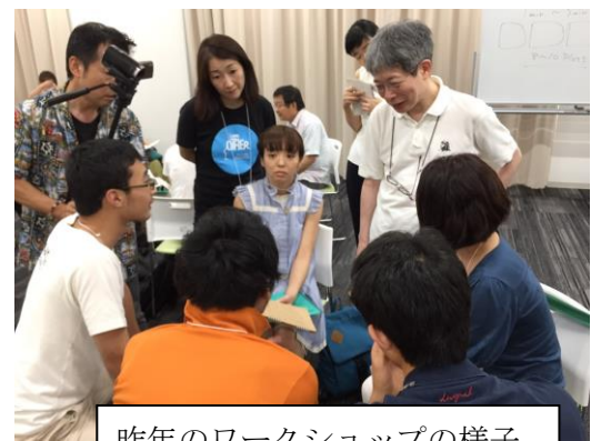
昨年のワークショップの様子