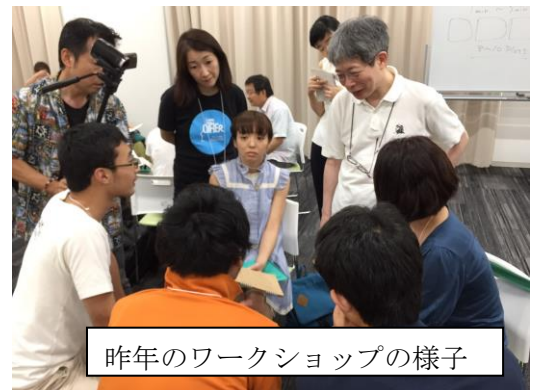
昨年のワークショップの様子